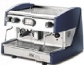
Electronic 1 group