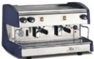
Semiautomatic 2 groups